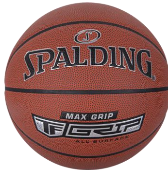
Max Grip talla 7 (Club)

Per problemes de subministrament per part de SPALDING motivats per una manca temporal d'estoc, el model de PILOTA SPALDING MAX GRIP TALLA 7 esdevé PILOTA AUTORITZADA per a la temporada 2022-2023 en les mateixes condicions que la TF500 (7).